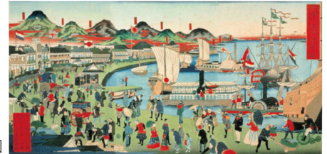
摂州神戸 海岸繁栄之図